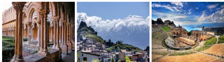
PROGRAMMA DI VIAGGIO